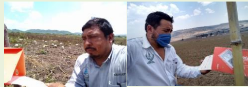
Revisión de Trampa