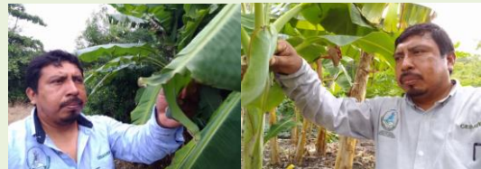
Ruta de Vigilancia y Parcela Centinela