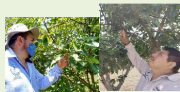
Exploración en huerta comercial y Ruta de vigilancia