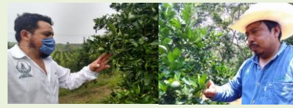
Exploración en área comercial y parcela centinela