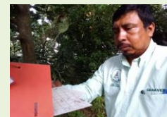
Revisión de trampa