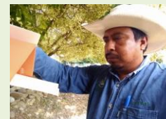
Revisión de trampa