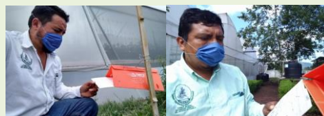
Revisión de trampa